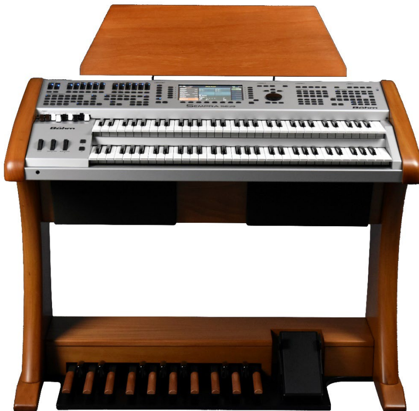
Böhm Overture stage – umgerüstet auf SEMPRA SE20 2.0 GST

Selbstverständlich können Sie Ihr umgerüstetes Instrument mit allen 2.0 GST-System-Apps sowie den SONG-, Sound- und Style-Paketen gem. Seite 24 ff. in dieser Preisliste ergänzen.